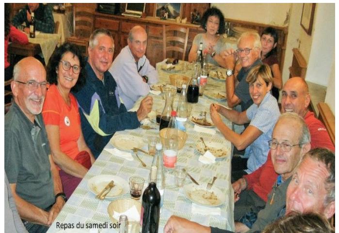
Repas du samedi soir