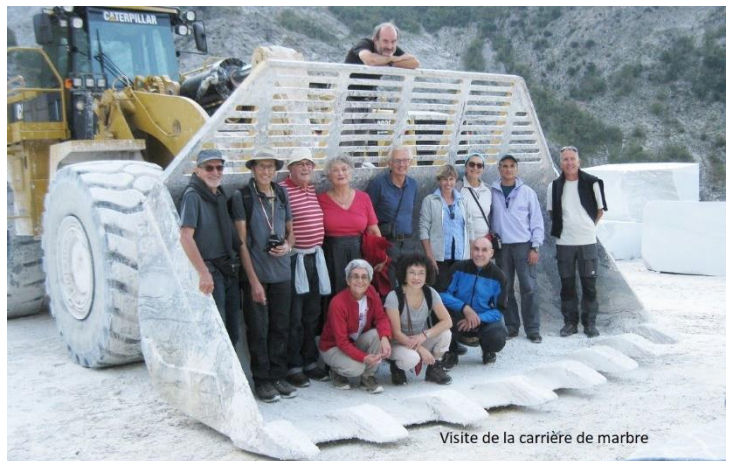
Visite de la carrière de marbre